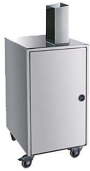
Mueble mini Mini stand Móvel mini Minimax - Minimatic