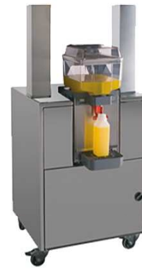
Mueble frigo Cooled dispenser stand Móvel frigo Basic - Bigbasic - Top - FastTop