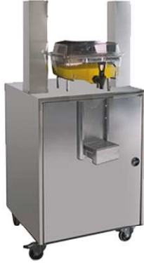
Mueble dispenser Dispenser stand Móvel dispenser Basic - Bigbasic - Top - FastTop